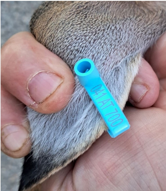
Figura 2: Particolare della marca auricolare con codice allevamento di provenienza.

Tutti gli esemplari presentano caratteristiche morfologiche tipiche della specie Lepus europaeus (Figura 3).