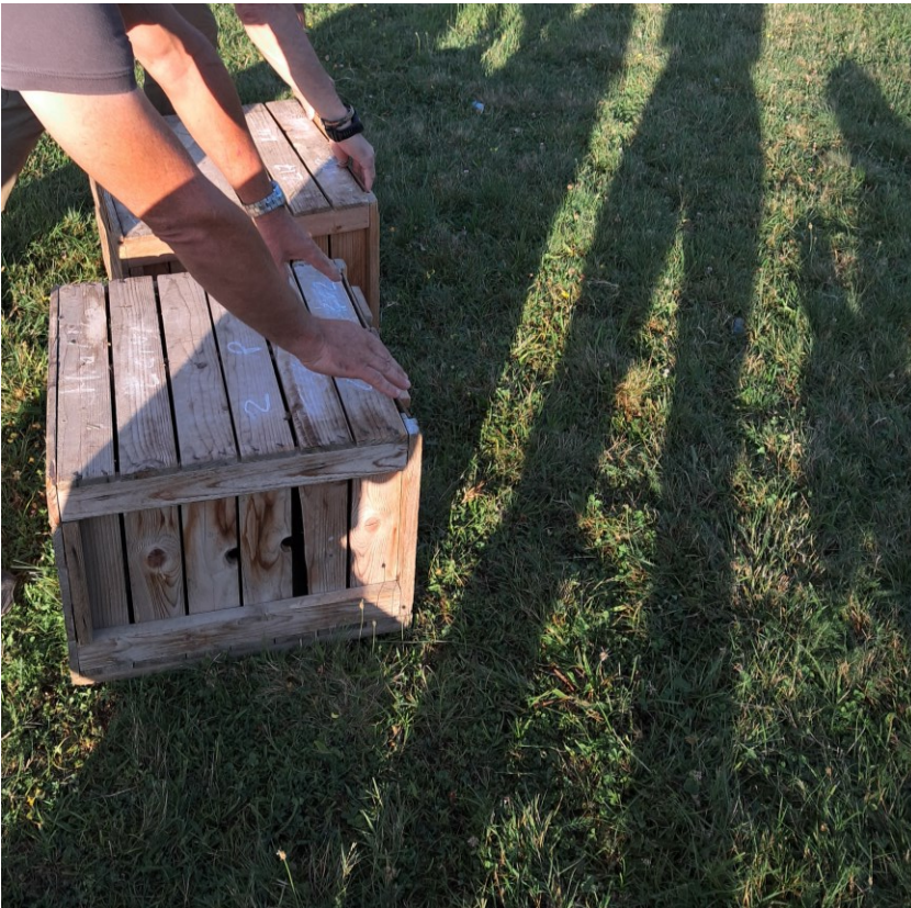
Figura 4: Momento del rilascio di 4 esemplari.

Morfologicamente presentano caratteristiche tipiche della specie.