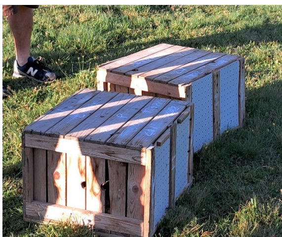
Figura 1: Cassette in legno utilizzate durante il trasporto delle lepri.

Durante la minima manipolazione per il rilascio è stata verificata la presenza del codice identificativo sulla marca auricolare sull'orecchio sinistro (Figura 2) di ogni singolo soggetto, verificato il sesso, accertando la corrispondenza a quanto dichiarato dal fornitore: n. 28 lepri di cui 14 maschi e 14 femmine di circa 4 mesi di età, con marche auricolari progressive dal n. 201 al n. 228.