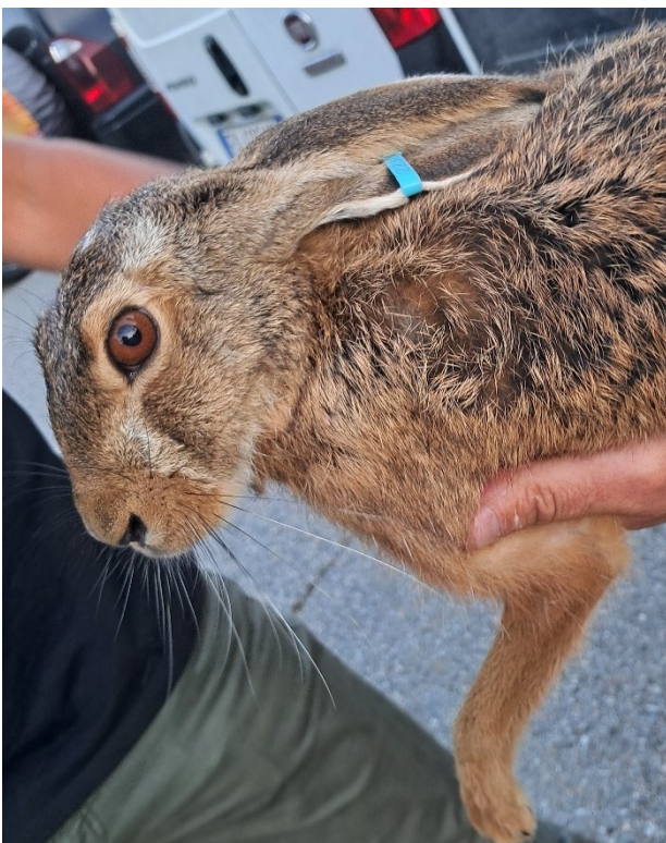
Figura 3: Particolare di testa ed arto anteriore con caratteristiche tipiche della specie.

Tutti gli esemplari presentano caratteristiche morfologiche tipiche della specie Lepus europaeus (Figura 3).